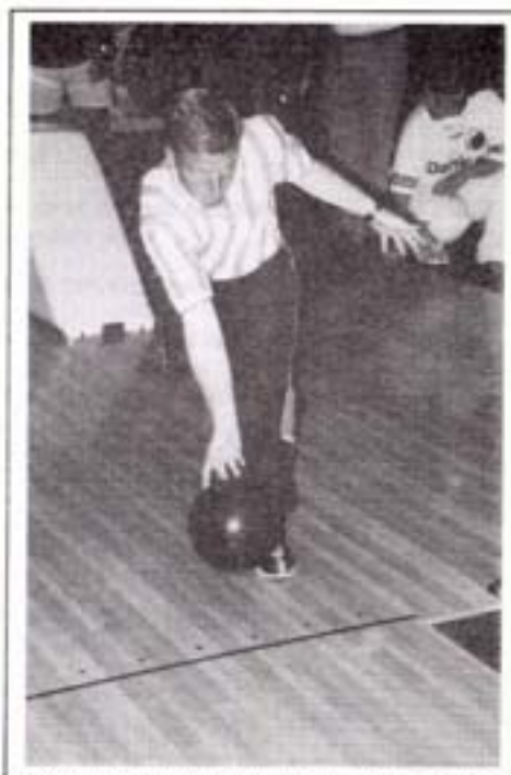
Brodre Johansen hygger sig altid når de er indblandet i en konkurrence.