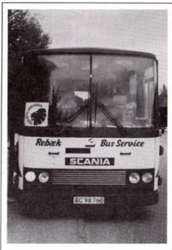
Er du også gået over til FCKFC's busture?

Forude venter kampen i Herfølge en helt ualmindelig onsdag aften på landet. Føj hvor jeg glæder mig. Vi har altid vundet i Herfølge og har brug for sejren og de 3 point efter en alt for beskedne pointtost siden Brøndby kampen (1 point). I en meget kedelig kamp på Lyngby stadion, hvor vi ufortjent var foran 2-0, smed foringen væk til sidst alligevel, men blev srydt for et klokkeklart straffe med vores planlagte redningsmand Falch. Nu skulle vore spillere og fans have oprejsning. Og det fik vi allerede, da vi mødte op på Prinsens Bodega. Her var stemningen og optimismen ikke til at tage fejl af - SEJR!