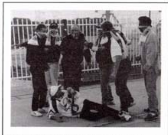
Døm selv om sandheden er kommet frem i lyset.

Da dette ikke lykkedes, begyndte vi istedet på vores slagsang, come on FC, flot styret af formanden med sin megaloni (det huskes ikke om han var den eneste der sang). Dette tog det tjekkiske politi som en provokation over for deres spillere, hvorefter de gik til angreb med låregas og trukne stave.