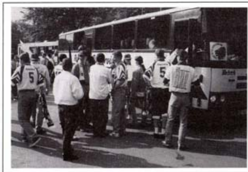
Stemningen er altid i top, når FCK-fans tager på bustur.

Som altid møder man nye medlemmer og "gamle" inkarnerede fans. Jeg kom selvfølgelig lige i sidste øjeblik og pludselig var vi afsted. 2 busser proppet med forventningsfulde FCK fans. Politikekskorte var unødvendig, dertil var hastigheden for høj, medens vi rasede ud af FC København og de lækre kvindelige deltagere klarede den fint som sirener. De altid billige og kolde drikkevarer fordelte sig efterhånden rundt omkring i bussen (og ganerne), selvom det nogen steder kunne se ud som om, at nogen troede, vi skulle længere ud på landet end Herfølge (don't mention Tjek.....)! Pludselig var den helt specielle stemning der igen. Den særlige duft af håb, drømme og stolthed. Min fintfolende fodboldnæse vejede guld og berømmelse. Men først skal vi lige have klaret respekten og sikre 3 absolut nødvendige point.