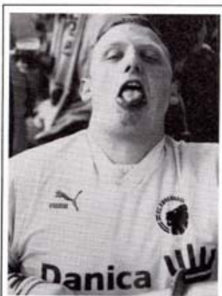
Denne mand mener, at han kender sandheden. Ter man nu også tro på det ?

Heldigvis så deres onde planer ud til at løbe i vasken, der var en fantastisk stemning i Parken, der var omdannet til en heksekedel, Nordens svar på Bernabeu Stadion. Det gjaldede ned mod de skræmte tjekkere 6-0 er nok og Ebbe Sand, din mor er en mand og den verdensberømte Ekstra Bladet lyver. Det kunne simpelthen ikke gå galt på trods af, at bladets udsendte noterede, at tjekkerne skindjakker var væk. Herefter fulgte dagens tredje skandale. Da spillerne og dommerne gik på banen for at varme op, var dommerne iført pelsjaker og var nede og omfavne de tjekkiske spillere og ønske dem held og lykke med kampen. Samtidig havde UEFA åbenbart dikteret, at Løverne skulle spille i blå dragter, hvilket for dem er en fuldstændig unaturlig farve på hjemmebane. Vi erfarede siden at det var en del af UEFA's onde komplot, nemlig at forvirre og ødelægge gudernes koncentration mest muligt. UEFA er åbenbart i lommen på den tjekkiske mafia, som selvfølgelig var mere interesseret i at få deres egne videre, frem for FC København.