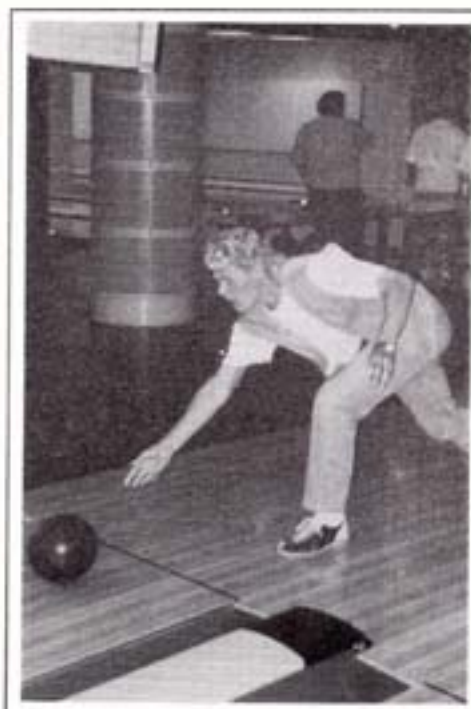
"Scharne" i kraftfuld stil.