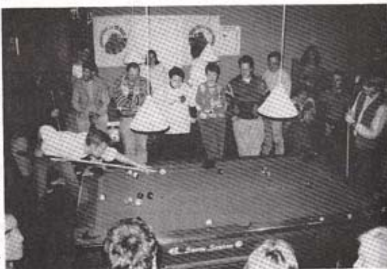
Mange var medt for, at se og hilse på FCK-spillerne.

Efter semi-finalerne var afviklet, stod det klart, at fanclubben ville tage grusom revanche fra sidste års nederlag. Dog bredte der sig en vis bekymring om spillerens selvtillid, da de stod foran en vigtig pokalkamp i Herfølge.