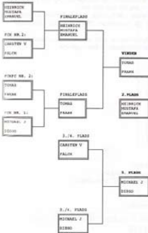
FCKFC NR. 1: