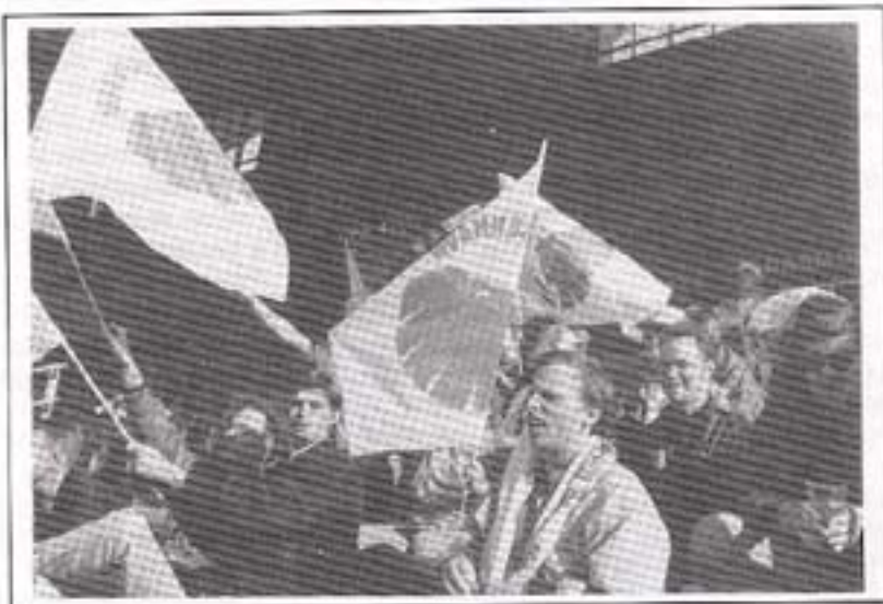
FCK-fans, ved FCK's første kamp i Parken.

I Fanclub bladet nr. 2 blev der udskrevet en konkurrence om hvad bladet skulle hedde. Denne konkurrence endte som bekendt med at bladet nu bliver kaldt Brølet, og blev vundet af undertegnede. Blad nr.3 var på mange måder en milesten. Det var det første som blev kaldt Brølet, og bar udenpå også vores fanclub logo ( i ved det med tungen). Ydermere var det det første med reklamer i. 1 stk Danica reklame.