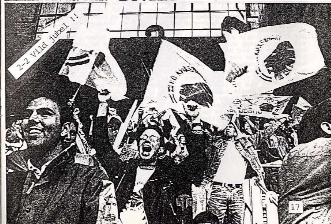
2-2 Villa jubel !!