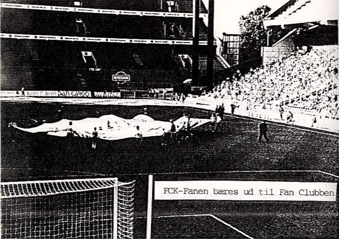
FCK-Fanen bæres ud til Fan Clubben