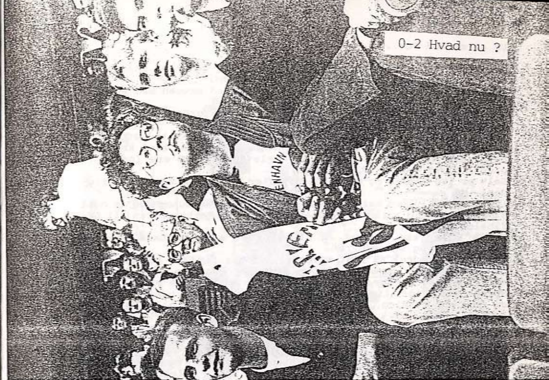
0-2 Hvad nu ?