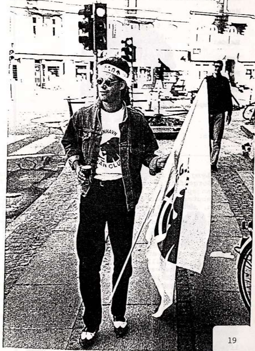
Bladets udsendte i FCKFC forklædning